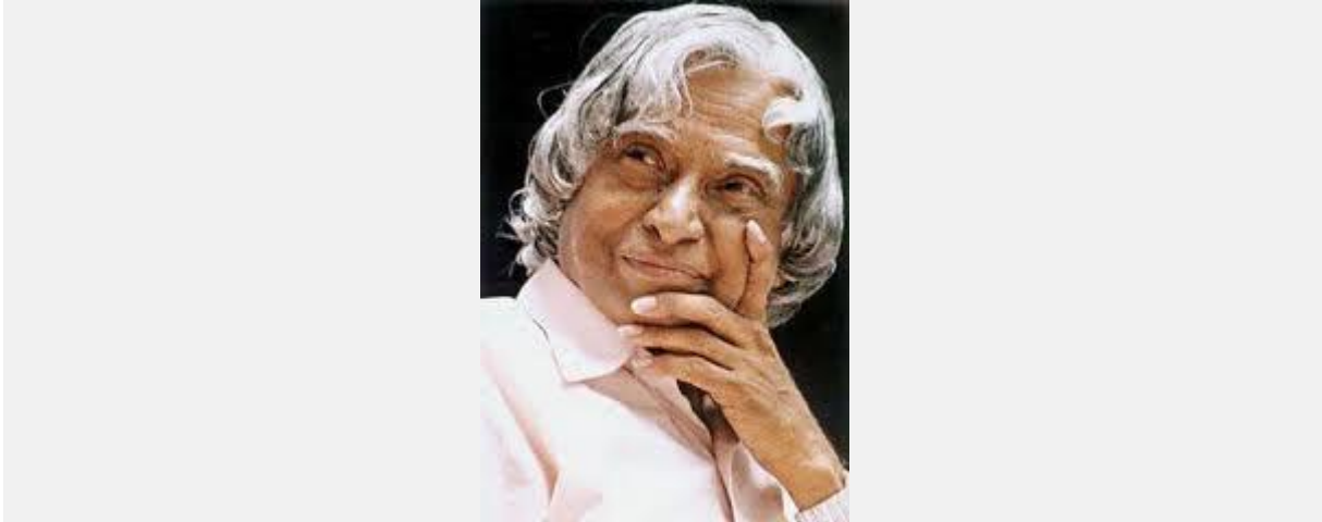
APJ Abdul Kalam